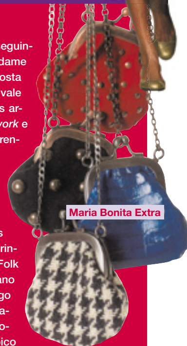
Maria Bonita Extra

Em outras palavras: opções não faltam. Boas combinações permitem montar um look completo, com acessórios curtir um inverno confortável e chic! ●