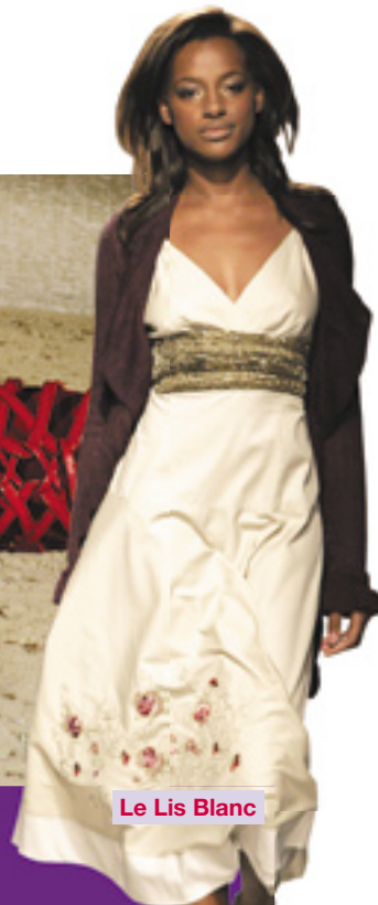
Le Lis Blanc