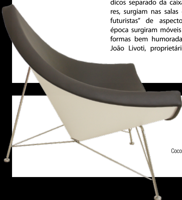
CONFORTO Cadeira Coconut (1955), criação de George Nelson artesian.com.br