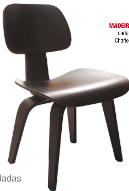
MADEIRA DCW e LCW, cadeiras criadas por Charles e Ray Eames.