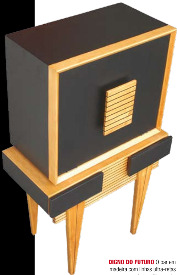
DIGNO DO FUTURO O bar em madeira com linhas ultra-retas www.desmobilia.com.br