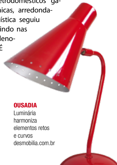
OUSADIA Luminária harmoniza elementos retos e curvos desmobilia.com.br

Fórmicas coloridas, móveis com pés palito, peças em madeiras nobres misturavam-se a plásticos e metais. “O design no Brasil seguiu a filosofia que predominava no campo político, com Juscelino Kubistchek, de avançar cinquenta anos em cinco”, comenta a professora Rosane Kaminski, do Centro Universitário Positivo (UnicenP). Os eletrodomésticos ganharam formas aerodinâmicas, arredondadas. A indústria automobilística seguiu a mesma tendência, investindo nas formas futuristas, que denotam movimento, fluidez. É o caso do Chevrolet Bel Air, um dos carros mais lembrados da Chevrolet, e mesmo o próprio Fusca, que começou a ser fabricado no Brasil em 1959 e que, em tempos recentes, voltou ao mercado repaginado, mas com a mesma forma de besouro.